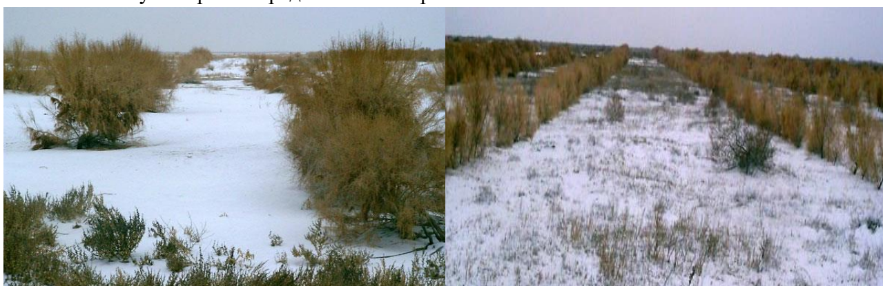
Рис.2. Посевы саксаула черного на пастбищах урочище Шуртугай

Данные показали, что густота растений тыс/га, в первом случае составила - 0,15, во втором - 1,2 и в третьей - 0,70. Лучшим способом оказался третий – заделка семян с граблями. Посевы саксаула черного представлены на рис. 2.